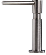
SAPONE SATINE R520 A00